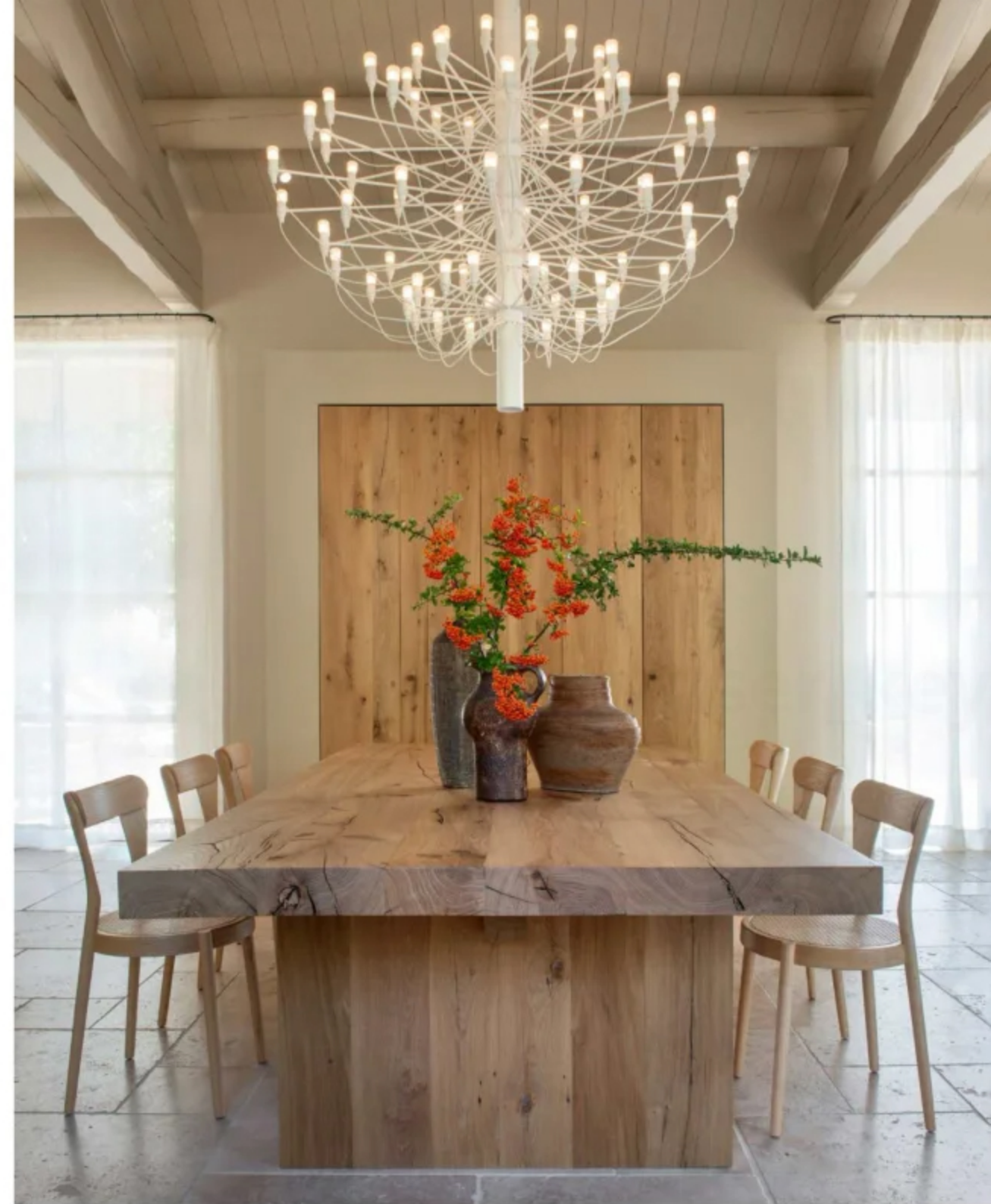
NOBLES MATIÈRES La salle à manger reste sobre avec une table réalisée par Laurent Passe. Céramiques années 1970 de Jacques Pouchain, galerie 50cinquante. Chaises, Passoni. Suspension « 2097/75 », Flos. Au fond, les portes dissimulent un bar. Voilages, Anavelis Création. PAGE DE GAUCHE Dans la partie cuisine: l'îlot et les façades des placards en bois brûlé ont été conçus et réalisés avec Laurent Passe. Sur le plan de travail en quartzite jungle, Marbrerie Sarrazit, coupe en bois, galerie 50cinquante. Devant le piano La Cornue, crédence en zellige noir, Pierres Méditerranée. Suspensions, Luceplan.